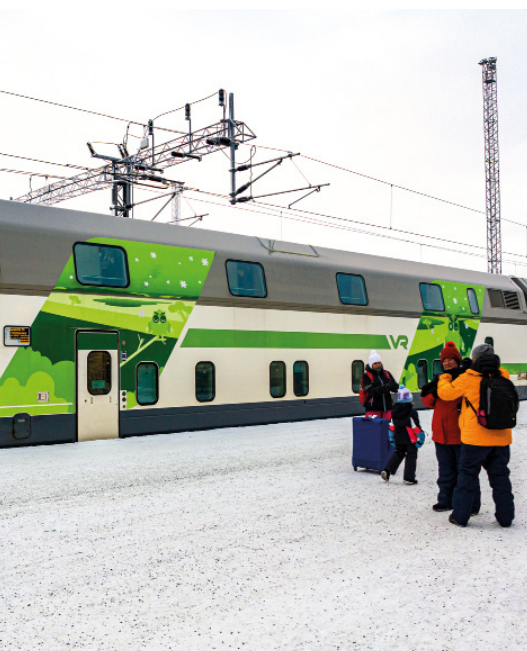
Santa Claus Train

Nach dem Frühstück geht es mit dem Regionalzug nach Hyvinkää. Dort steht der Besuch des denkmalgeschützten finnischen Bahnmuseums auf dem Programm. In drei Hallen finden wir zahlreiche Exponate, Lokomotiven und Wagen der finnischen Eisenbahngeschichte. Einen Mittagsimbiss nehmen wir in der Brasserie ein. Anschließend geht es mit dem Zug zurück nach Helsinki. Bei einem geführten Spaziergang durch die Stadt werden wir weitere Orte kennenlernen, wie die Besichtigung der Oodi-Bibliothek, der Musiikkitalo-Konzerthalle, der Finlandiahalle und der Felsenkirche. Optional und fakultativ gemeinsames Abendessen im Res-