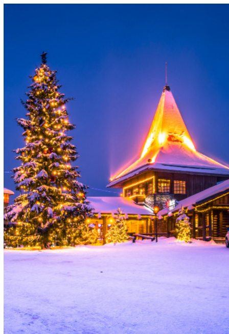
Santa Claus